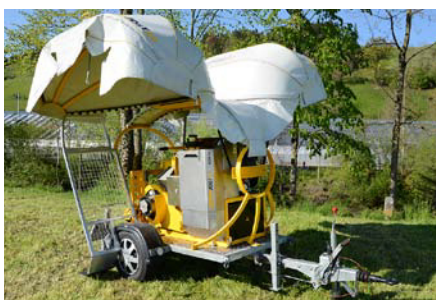
Le KZW 20 sur remorque

«made in Switzerland». La certification TÜV nous conforte dans nos choix et nous incite à poursuivre dans la voie de l'innovation, de la qualité et de la sécurité.