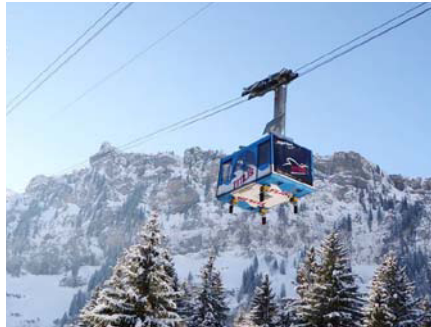
Téléphérique Titlis Stand: 2428 m. au-dessus du niveau de la mer

Thomas Gasser, responsable Construction réseaux EWO