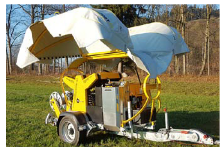
Le KZW 40 sur remorque