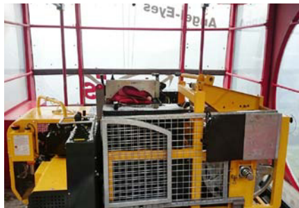
Transport dans le téléphérique vers Titlis Stand