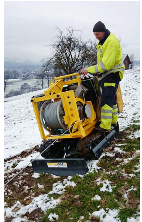
Utilisation en tout-terrain