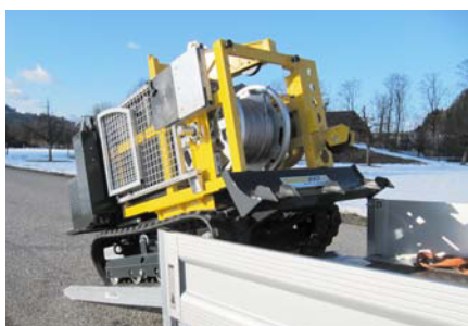
le KZW 20 sur véhicule à chenilles RK 049