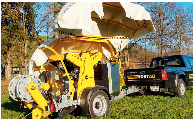
Treuil à cabestan RSW 40 avec structure bâchée ouverte sur un côté