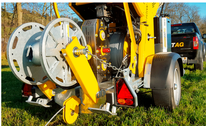
Zusatzhaspelantrieb zum Vorseilen und Kalibrieren

Tel.: +49 174 949 24 36; E-Mail: m.schoening@jostag.ch