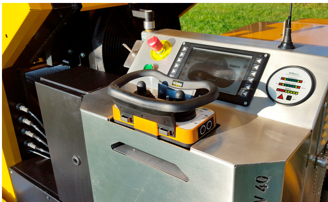
Maschinensteuerung PMC 14 mit Funkfernbedienung