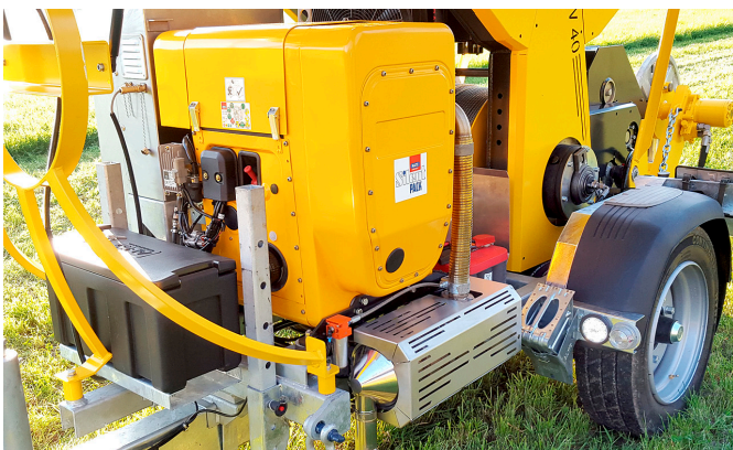
Lärmgekapselter Dieselmotor Hatz mit Partikelfilter