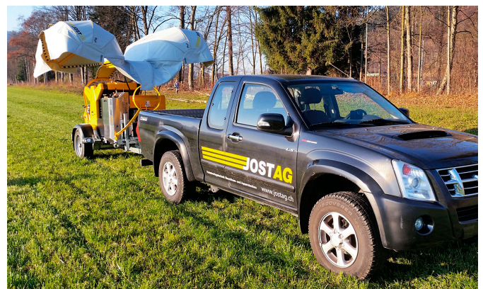
RSW40 mit beidseitig offenem Blachenverdeck