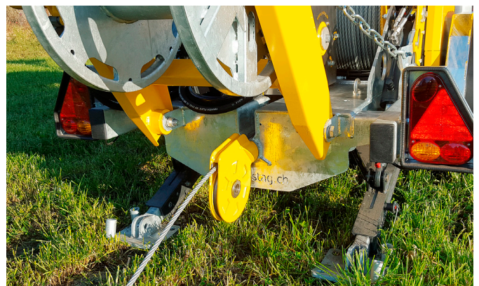
Zentraler Seileinlauf mit drehbarer Einlaufrolle und hydraulischen Ankerstützen